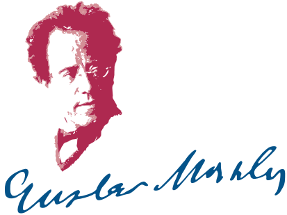
Gustav Mahler Stichting Nederland